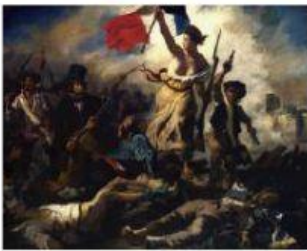
toma de bastilla

3. Seleccione cuales pertenecen a pensamiento de libertad.