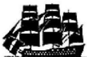
Siglo XVIII. Navío