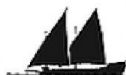
Siglo XVI. Galera