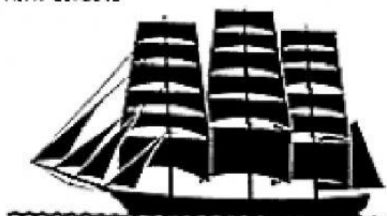
Siglo XIX Fragata