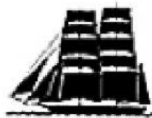
Siglo XIX. Corbeta