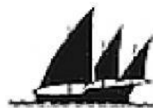
Siglo XV. Carabela latina