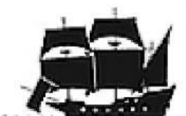
Siglo XVI. Galeón