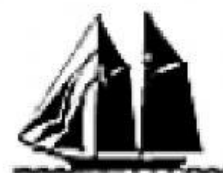
Siglo XIX. Goleta