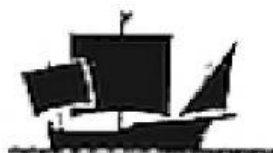
Siglo XV. Carabela redonda