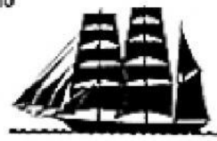
Siglo XIX. Corbeta