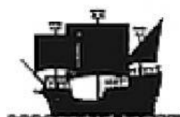
Siglo XV. Carraca