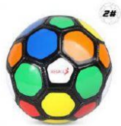
Bola de futebol - R$ 89,00