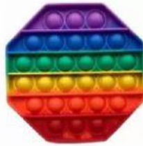
Popit Fidget Toy Empurre Spinner Bolha - R$ 15,00