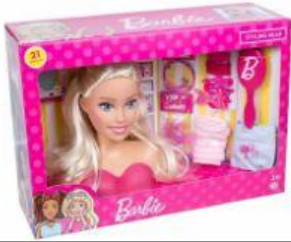
Boneca Barbie Faça Penteados Busto Com Acessórios - R$ 70,00

Veja as ofertas encontradas na loja de brinquedos: