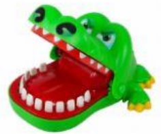
Brinquedo Educativo Crocodilo Dentista - R$ 56,00