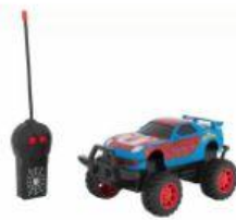
Carrinho de Controle Remoto Spider Man - R$ 106,00