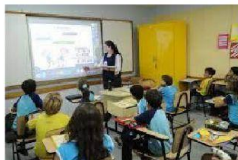
ESCOLA DA ATUALIDADE