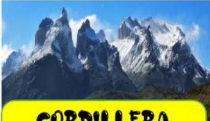
CORDILLERA DE LOS ANDES

9. La selva se caracteriza por tener muchos