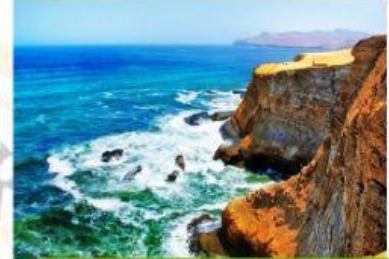
SUS PLAYAS Y PECES