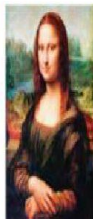
La Gioconda, 1519