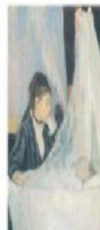
La cuna, 1872