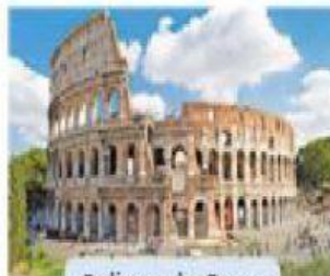
Coliseo de Roma LXXXIII

Escribe el año en el que se construyeron estos edificios.