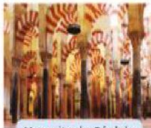
Mezquita de Córdoba CMLXXXVII