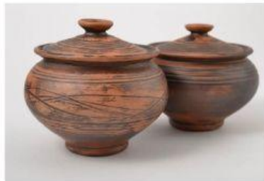
VASIJA DE BARRO