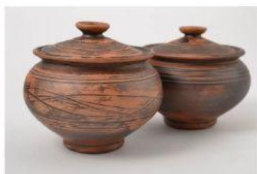
VASIJA DE BARRO