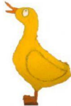
LA PAPERA GIALLA