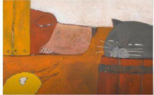
I SUOI AMICI

LA GALLINELLA HA MACINATO IL GRANO PER FARE LA FARINA. ORA VUOLE IMPASTARE IL PANE. SCRIVI GLI INGREDIENTI CHE LE SERVONO! AIUTATI CON LE IMMAGINI.