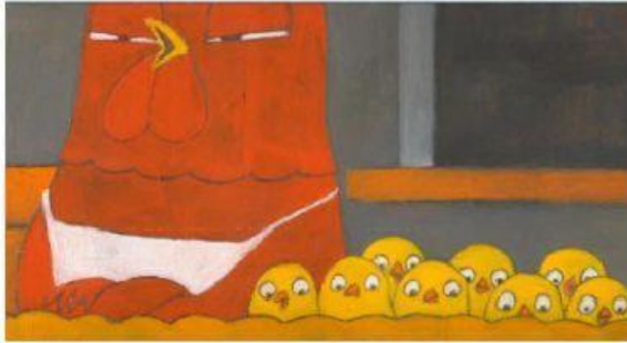
LA GALLINELLA E I SUOI PULCINI

CHI MANGIA IL PANE ALLA FINE DELLA STORIA?