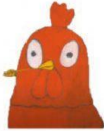
LA GALLINELLA ROSSA