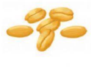
SEMI DI GRANO