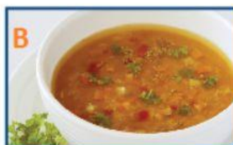
MINISTRONE DI VERDURE