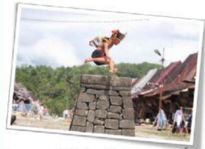
Lompat Batu Fahombo (Nias).