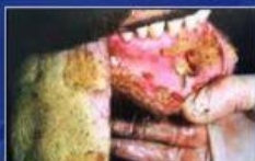
Penyakit mulut dan kuku pada sapi