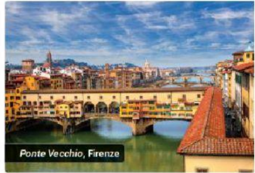
Ponte Vecchio, Firenze