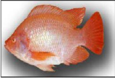
cá ...iêu hồng