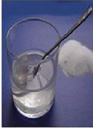
Agua con sal