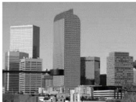
Uma cidade é uma paisagem cultural, pois foi criada pelo homem

Paisagem Cultural: aquela que o homem já modificou, composta por objetos sociais como construções, cidades etc.