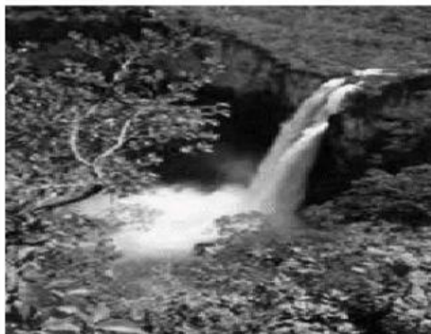
Uma cachoeira é uma paisagem natural, pois não foi construída pelo homem

Paisagem natural: aquela que o homem ainda não modificou, composta por objetos naturais como rios, árvores e montanhas.