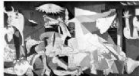
EL GUERNICA (PICASSO)