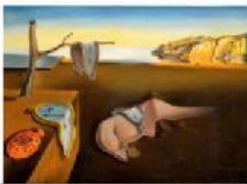
LA PERSISTENCIA DE LA MEMORIA (DALÍ)