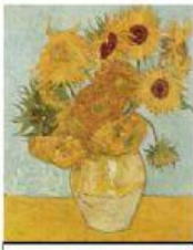
LOS GIRASOLES (VAN GOGH)