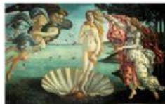
EL NACIMIENTO DE VENUS (BOTTICELLI)