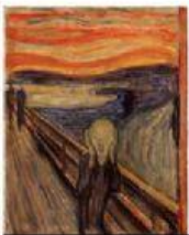
EL GRITO (MUNCH)