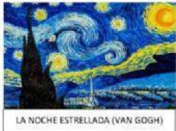
LA NOCHE ESTRELLADA (VAN GOGH)