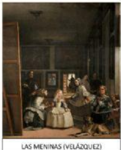
LAS MENINAS (VELÁZQUEZ)