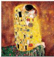
EL BESO (KLIMT)