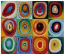
ESTUDIO DE COLOR CON CUADROS (KANDINSKY)