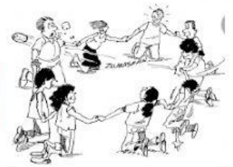
HACER UN CÍRCULO