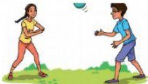
LLAMAR A LOS AMIGOS