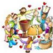
La familia de los cristianos