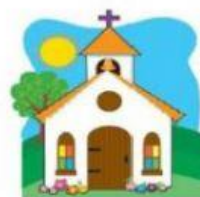
El templo de los cristianos

Existen iglesias diferentes. Selecciona la respuesta correcta