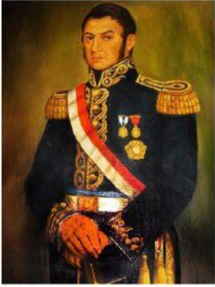
José de San Martín