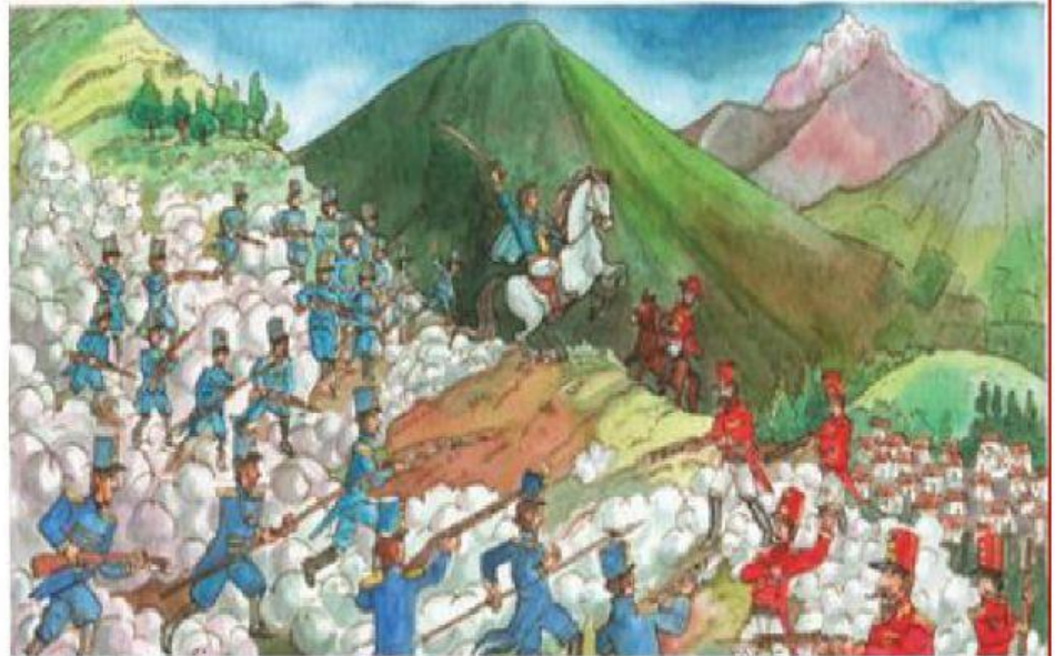
Batalla de Pichincha

El Libertador inició, de esta manera, una carrera desde Caracas hasta Guayaquil, donde las autoridades coloniales no pudieron resistir el avance de sus tropas. Luego de la gesta de Boyacá, le siguieron la batalla de Carabobo para liberar a Venezuela y, finalmente, la batalla de Pichincha para liberar a Ecuador, junto a su comandante Antonio José de Sucre, el 24 de Mayo de 1822.