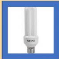
LAMPU NEON JARI