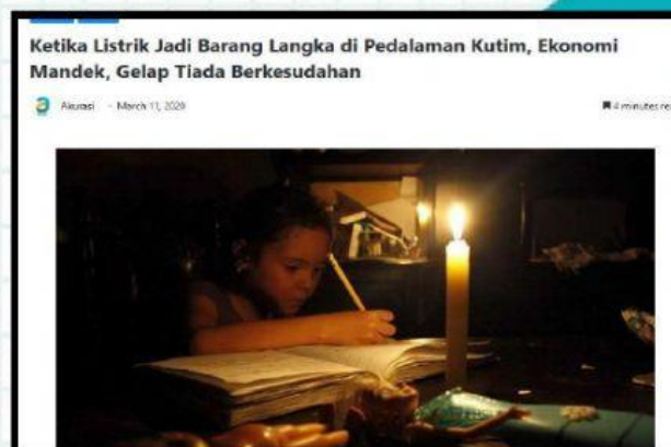
Gambar 1 Tidak adanya energi listrik di kutim

Yang tidak dapat mengakses: Perhatikan gambar di bawah ini!