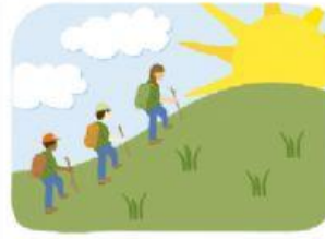
walk up a hill