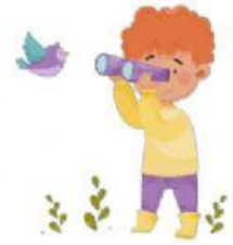
look at birds