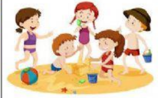
play on the sand

2) Nghe, chỉ tay vào đúng câu và đọc theo (3 lần)