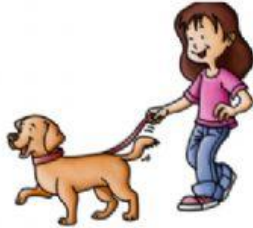
walk the dog