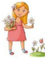
pick some flowers