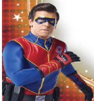
IMAGEM LEGO COM BR