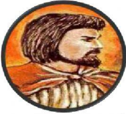
PEDRO ARIAS DÁVILA