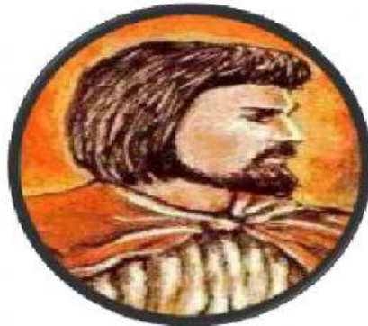
PEDRO ARIAS DÁVILA