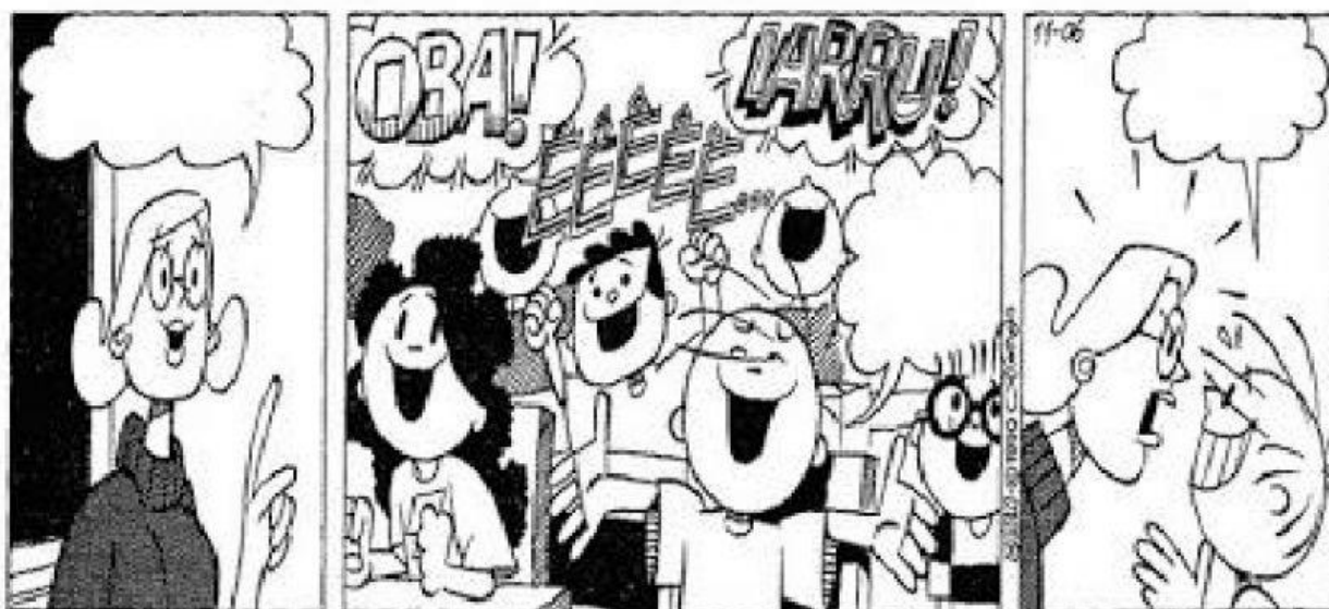
O Menino Maluquinho em quadrinhos, Ziraldo, L&PM.

2 – Invente uma história do Menino Maluquinho de acordo com as imagens e expressões faciais.