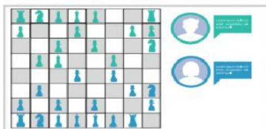
ajedrez en línea

1.2. Observa las siguientes imágenes, ¿cuál(es) no son juegos motores?, ¿por qué?