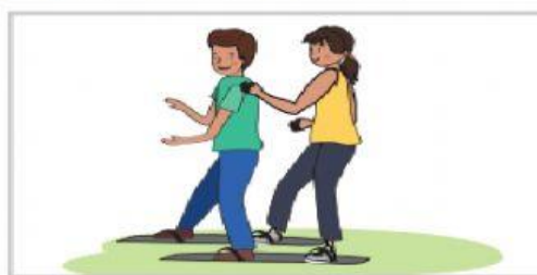
caminar sobre una tabla

TAREA 2: PRACTICAMOS JUEGOS MOTORES PARA PROMOVER LA CONVIVENCIA FAMILIAR