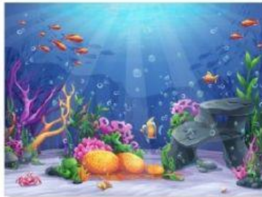
b) Animales marinos