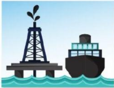
a) Petróleo y gas

1. RELACIONA LOS RECURSOS NATURALES CON LOS BIENES QUE OBTENEMOS DE ELLOS. OBSERVA LOS EJEMPLOS.