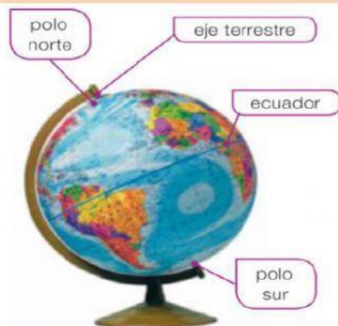
❶ El globo terráqueo.

A pesar de que el globo terráqueo es la mejor forma de representar la Tierra, tiene ciertos problemas. Por ejemplo, no podemos ver a la vez todos los continentes. Para solucionar esos problemas, se crearon los mapas.