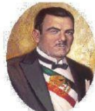
Gobierno a cargo del presidente Plutarco Elías Calles

En 1926 el presidente Calles expidió una ley que prohibía el culto externo.