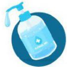
HAND WASH GEL