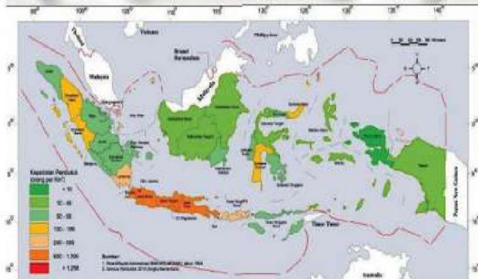
Kepadatan Penduduk Indonesia Menurut Provinsi 2010

Amatilah peta persebaran kepadatan penduduk di Indonesia berikut.