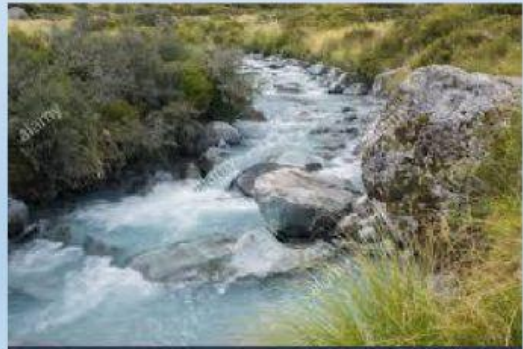
Alimentato da ghiacciai