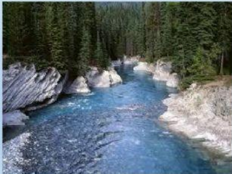
Alimentato da piogge

Il fiume è un corso d' acqua perenne che scorre sulla superficie terrestre, può essere alimentato dalle precipitazioni piovose , dallo scioglimento di nevi o ghiacciai