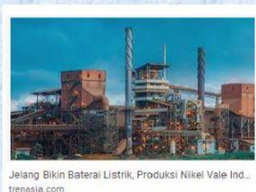
Jelang Bikin Baterai Listrik, Produksi Nikel Vale Ind... trenasia.com