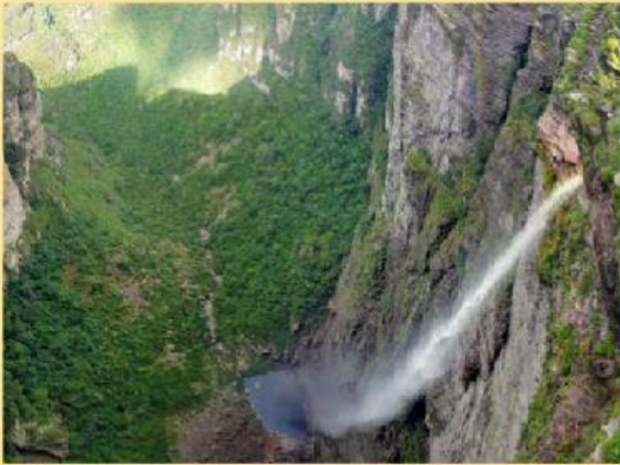
CACHOEIRA DA FUMAÇA NA BAHIA Possui 380 metros de queda livre.