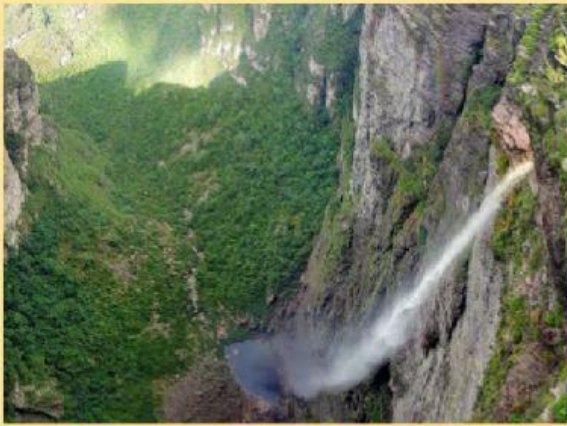
CACHOEIRA DA FUMAÇA NA BAHIA