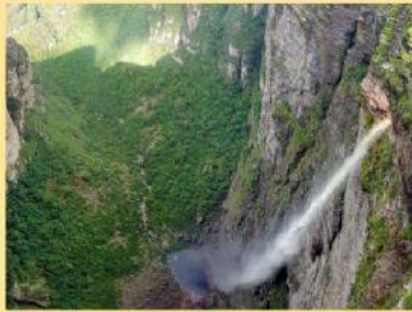
CACHOEIRA DA FUMAÇA NA BAHIA