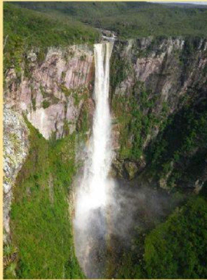
CACHOEIRA DO EL DORADO NO AMAZONAS Possui 353 metros de altura.

Marque um X no quadro abaixo, o número que indica a diferença em altura relacionada à queda livre entre elas.