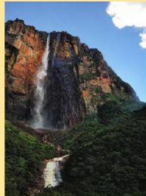
CACHOEIRA DO EL DORADO NO AMAZONAS