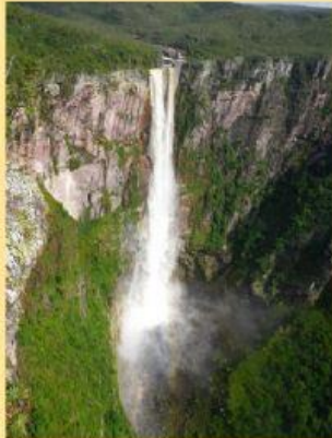
SALTO DE ANGEL NA VENEZUELA

INDIQUE A POSIÇÃO DE CADA UMA CONFORME A SUA ALTURA.