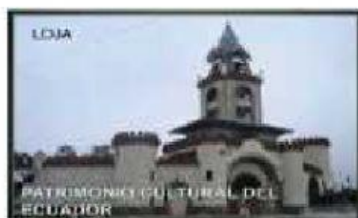
PUERTA DE LA CIUDAD