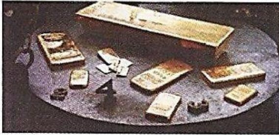
A- ▲ Oro