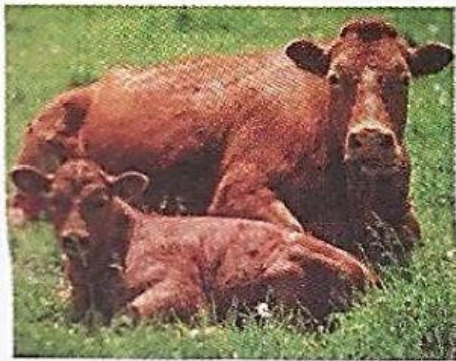
C- ▲ Vacas