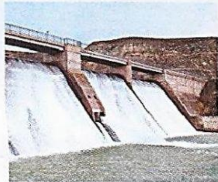
D- ▲ Agua