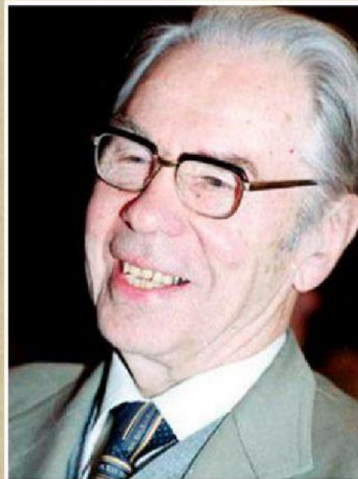
Ф.П. Решетников (1906-1988 гг.)

Место рождения: украинское село Сурско-Литовское. Семья потомственного иконописца.