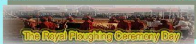
The Royal Ploughing Ceremony Day