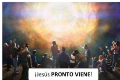
¡Jesús PRONTO VIENE!