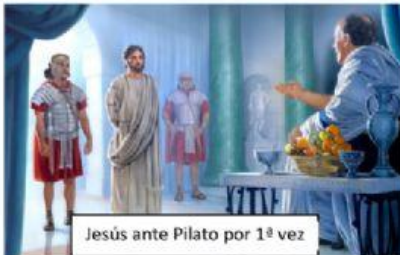
Jesús ante Pilato por 1ª vez