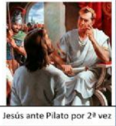
Jesús ante Pilato por 2ª vez