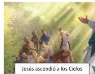
Jesús ascendió a los Cielos