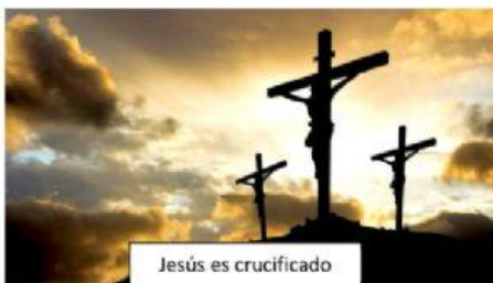
Jesús es crucificado