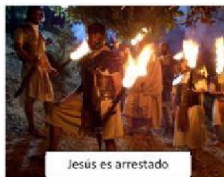
Jesús es arrestado