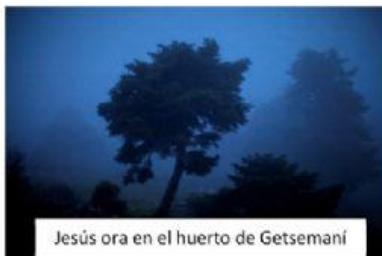
Jesús ora en el huerto de Getsemaní