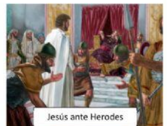
Jesús ante Herodes