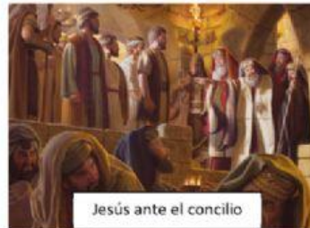
Jesús ante el concilio