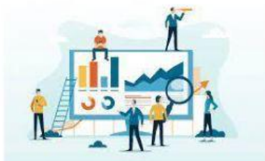
MEDICIÓN DE RESULTADOS