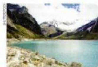
Origen de un elemento de la naturaleza