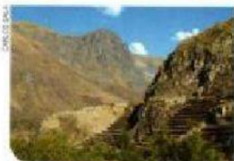
Origen de un monumento histórico o arqueológico

1 Nos preparamos. Elige qué tratará de explicar tu leyenda.