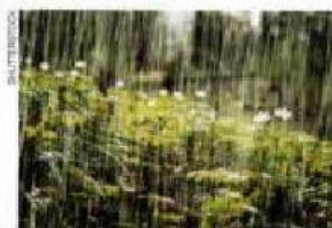
Origen de un fenómeno de la naturaleza