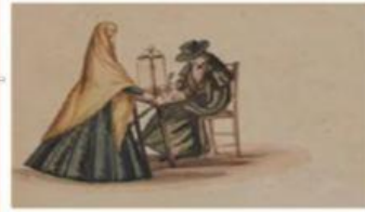
Tapada y escribano, Francisco "Pancho" Fierro. Acuarela sobre papel. Siglo XIX

¿A qué época de la historia peruana representa?