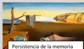
Persistencia de la memoria