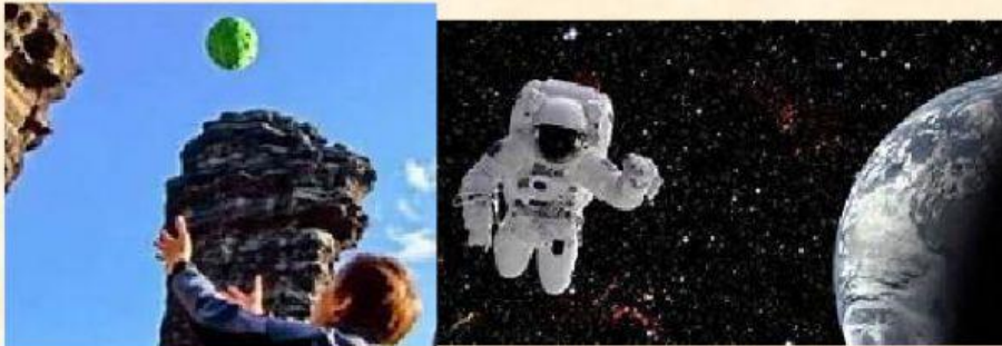
Gambar 1. Bola dilempar gambar 2. Astronot melayang Sumber gambar 1 dan 2 www.google.com

Perhatikan kedua gambar tersebut. Setelah itu diskusikan pertanyaan berikut ini.