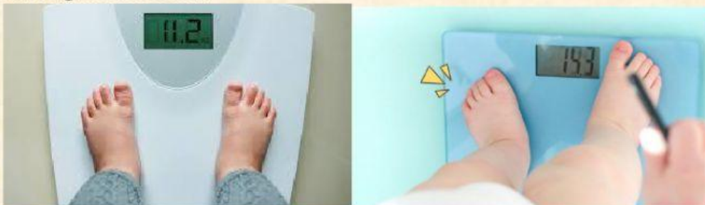
Gambar 3. Timbangan digital. Sumber www.google.com

Sering sekali, kita mendengar bahwa berat tubuh kita berbeda jika ditimbang di daerah khatulistiwa dengan di daerah kutub. Perbedaan berat tubuh disebabkan oleh percepatan gravitasi yang berbeda di kedua daerah. Nah sekarang, diskusikanlah pertanyaan di bawah ini.