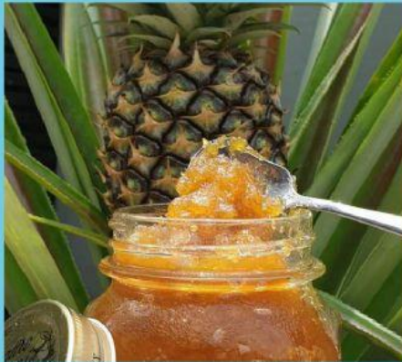
(a) Gambar selai nanas

Sebelum mulai mengerjakan LKPD silahkan perhatikan gambar dibawah ini: