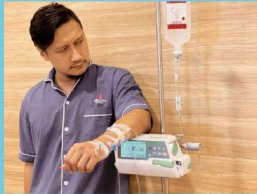
(b) gambar orang sedang diinfus

(a) Selai nanas adalah salah satu jenis makanan awetan yang berasal dari buah nanas yang sudah dihancurkan, ditambah gula dan dimasak hingga kental atau berbentuk setengah padat. Dalam industri makanan terutama yaitu untuk proses pengawetan makanan. Prinsipnya memanfaatkan terjadinya krenasi pada sel dimana untuk mengawetkan makanan, industri makanan biasanya menggunakan gula dengan jumlah banyak untuk menghasilkan larutan konsentrasi tinggi.