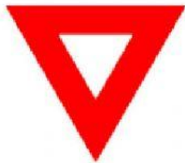
DÊ A PREFERÊNCIA