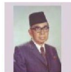
Tun Abdul Razak