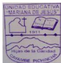
COORDINACIÓN ACADÉMICA REVISADO POR: