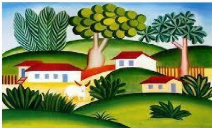
Paisagem com touro, 1925. Tarsila do Amaral

Tarsila do Amaral (1888 – 1973) pintora, desenhista e tradutora brasileira, foi uma das figuras centrais da pintura do movimento modernista no Brasil.