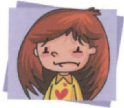
Estela está apenada.