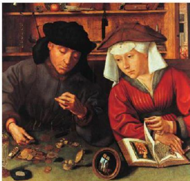
↑ Quintín Massys, El cambista y su mujer . (1514).

Observa la siguiente imagen y luego responde la pregunta 3 y 4.